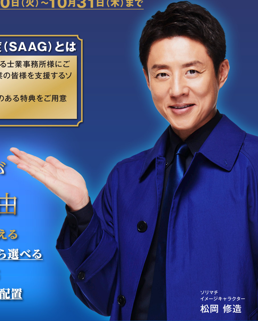
ソリマチ イメージキャラクター 松岡 修造

今なら 株式会社日税サービス西日本限定 無料にてソリマチSAAG制度にご加入いただけます。