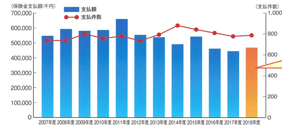
【毎年のお支払い実績】